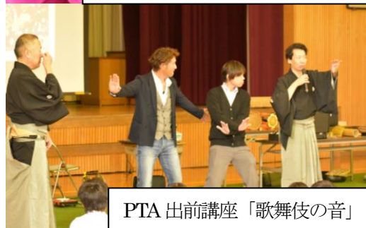
PTA 出前講座「歌舞伎の音」