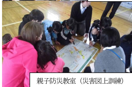
親子防災教室(災害図上訓練)